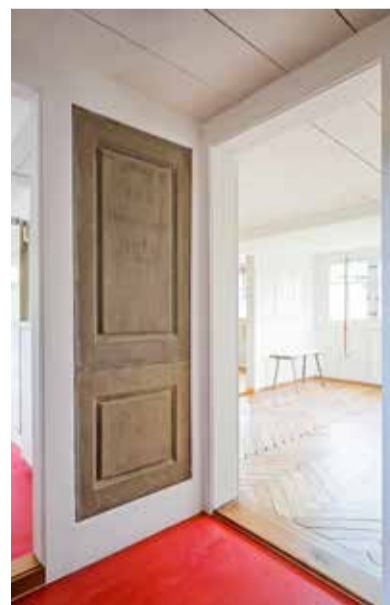
Oben: Die originale Inschrifttafel aus Sandstein aus dem Jahr 1888 ist eines der Highlights, das der Innenumbau zum Vorschein brachte.

Links: Ursprüngliche Massivholzböden (Dillböden) und -wände (Strick) anstelle von PVC-Belägen und Industrietäfer.