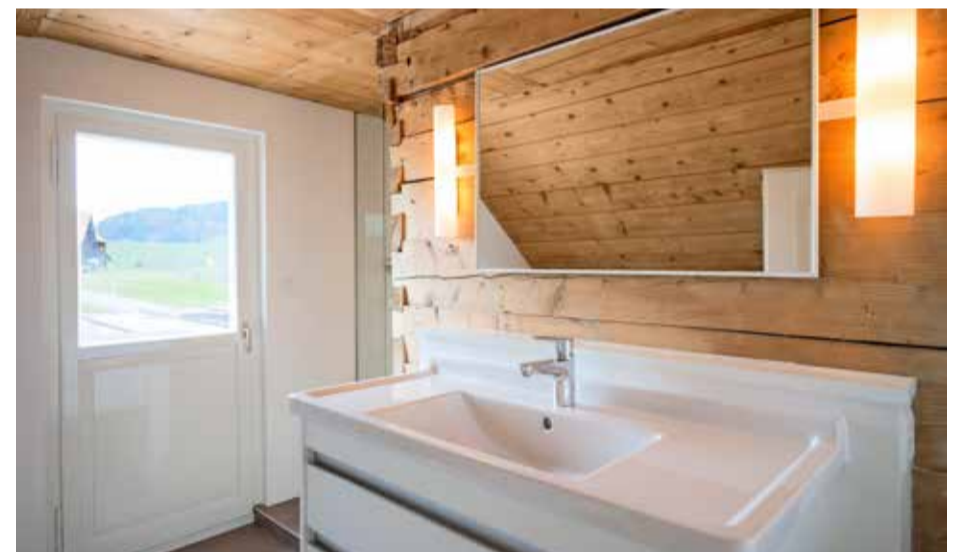
Stilvolle Kombination von Alt und Neu in den Nasszellen des Hauses (oben und links). Die moderne Zweiflügel-Glaskusche bildet einen schönen Kontrast zum Holzstrick an den Wänden.

Danach stand die Wahl der Handwerksunternehmen an. Es sollten Firmen sein, die mit der alten Baustanz sorgfältig und kompetent umgehen – im Appenzellerland zum Glück noch die Regel. Gemeinsam mit einer Auswahl von Firmen der IG altbau wurde das Projekt schliesslich gestartet. Die Bauherrin, selber bauerfahren, übernahm die Bauführung und die Feingestaltung. Der Architekt stand beratend zur Verfügung. In Teamarbeit wurde die Rückverwandlung des Häuschens mit viel Elan umgesetzt – und damit dem Haus seine Seele zurückgegeben.