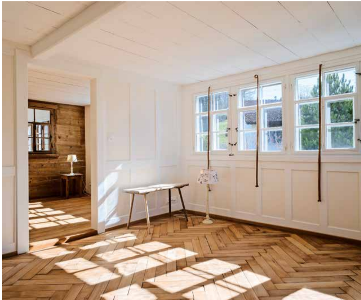
Nach der Renovation erstrahlt die Stube in ihrem ursprünglichen Glanz: Fischgratparkett, Kassettenwände und Sprossenfenster aus dem Baujahr 1888.

Dann begann die Phase des Rückbaus und der Freilegung. Wie vom Architekten in Aussicht gestellt, fanden sich unter diversen Schichten alter Strick (Massivholzwände), Dillböden (selbsttragende Massivholz-